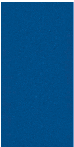
Bleu 2500 sablé