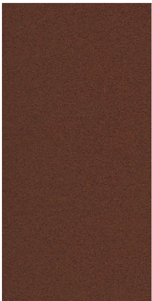
Mars 2525 sablé