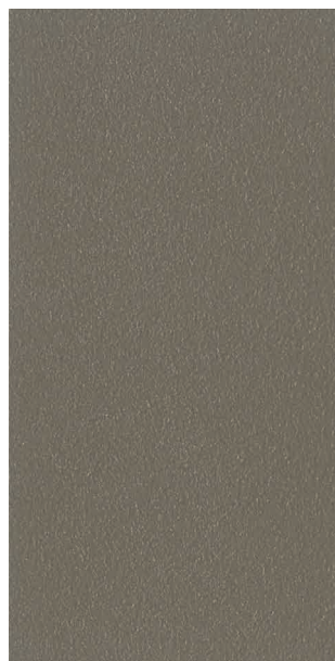
Gris 2500 sablé