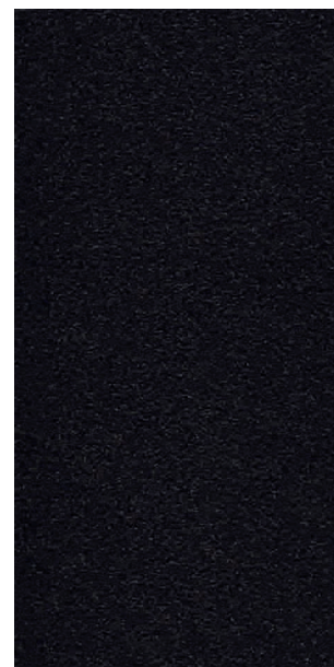
Noir 2100 sablé