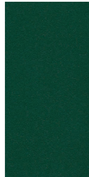
Vert 2500 sablé