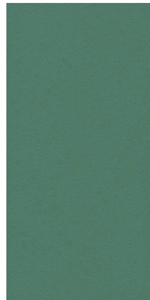
Vert 2300 sablé