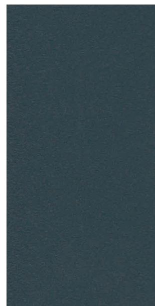
Bleu 2600 sablé