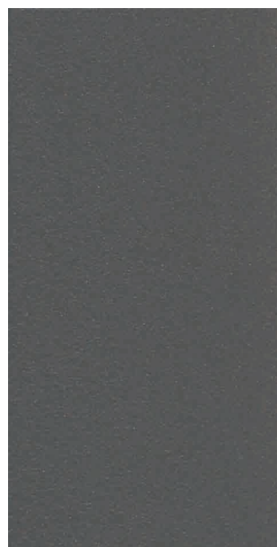
Gris 2900 sablé